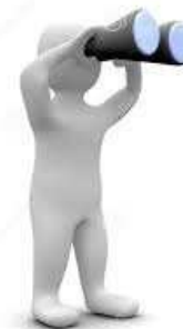
Souplesse et prévoyance