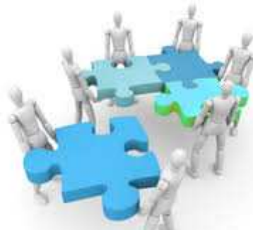
Institutions et droits